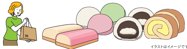
イラストはイメージです

自分を買うのは、もったいないけど、お友達の家にお呼ばれされたり、ちょっとした時の土産に喜んでいただけた品物をご紹介します。