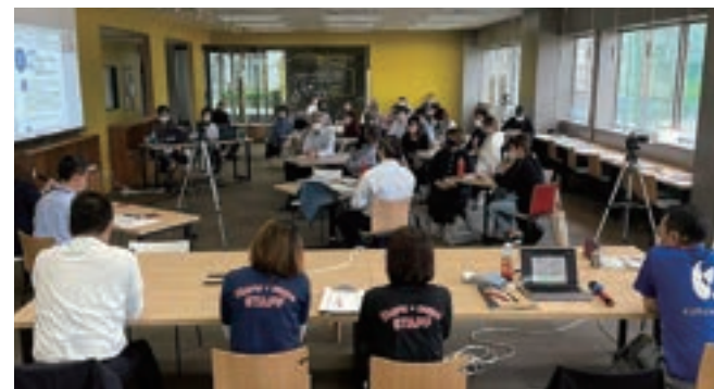
市民活動団体と企業との交流会(久留米大学 地域連携センター つながるめにて)

久 留米市市民活動サポートセンターみんくるは、市民活動団体と地元企業・事業者との新しい「関係づくり」をサポートしています。地域課題解決・SDGs・ソーシャルビジネス・SOCIAL GOODの勉強会や交流会の開催、非営利組織と営利組織の強みを掛け合わせるプロジェクトの立ち上げ支援等、新しい「関係づくり」に関するご相談は、みんくる窓口へお問合せください!