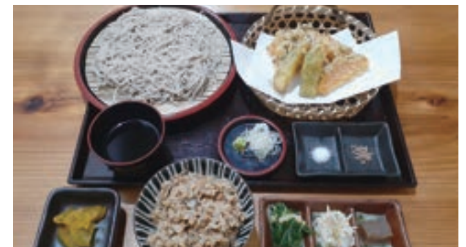
●おすすめランチ(写真) 桜エビと玉ねぎのかき揚げご飯セット 1,150円