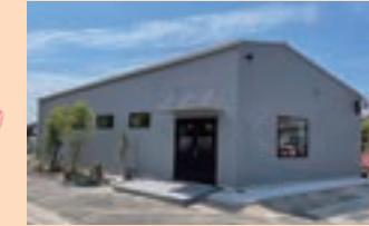
グレーで統一されたお洒落な外観です。