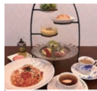
【ランチ】アッカおすすめのパスタメインコース¥1,870(税込)