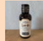
HAIR OIL ¥4,180

香り フレッシュで魅力的な美しい香り。ゼラニウムの甘すぎないフローラルで爽やかな香りとレモングラスの刺激が、心安らくフレグランス。