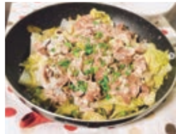
【時短・簡単・絶品レシピです!】