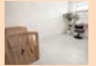
小さなお子様と一緒に来店でも安心のキッズスペース。

2021年6月6日(日)にOPENさせていただきました。『ナイン』で覚えてください。サロンコンセプトは[Stand be side]です。お客様に寄り添える美容室になりたいと想っております。髪を切るだけが美容室ではなく、目の前のお客様の永い人生に寄り添えるように、お客様の節目節目に携われるように、技術はもちろん、接客やサービスも力を入れていきたいと考えております。