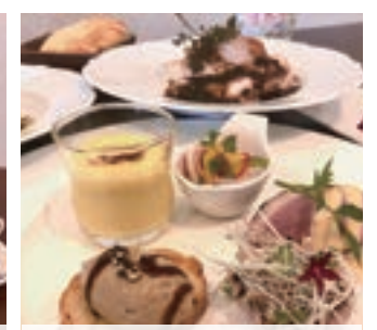
【コース】ディナーAコース¥3,410(税込)

i taliano h(angolo della strada) (イタリアーノ アッカ) angelo della stradaは、今年2022年5月20日に、前身の善導寺町「piccola cucina 時の庭」から移転して、日吉町に生まれました。h(アッカ)とは、イタリア語で発音しない単語の1つですが、ないというわけにはいかない大切な存在です。人の「食卓」「ご馳走様」を大切に、「美味しい食卓には花が咲く…」陰ながら底から支えたい思いでネーミングしました。単品から、異なったお集まり事まであらゆるシチュエーションまで対応し、本格イタリア料理を堪能できます。地場食材はもとより、塩、オリーブオイルに至るまで日々厳選した素材重視の、街角に佇むシンプルなイタリアンをお楽しみください。