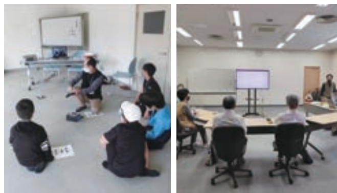
ドローンのプログラミング教室とシニア向けスマートフォン教室模様

楽 しみながら学べるドローンを使ったプログラミング教室を開いています。また、高齢者がデジタル社会から取り残されないようにシニア向けスマートフォン教室も開催しています。 ●ドローン教室…毎月第3日曜日14時から、くるめウスで ●スマホ教室(無料相談教室)…毎月第3木曜日10時30分から、みんなくまで開催しています。一度寄ってみてください。