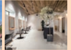
優しい調光で演出された内観です。